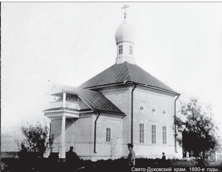
Свято-Духовский храм. 1890-е годы..