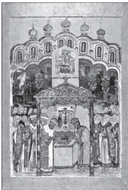
Положение честной ризы Господа нашего Иисуса Христа в Москве. XVIII в.

23 июля — Неделя (воскр.) 7-я по Пятидесятнице. Положение честной ризы Господа нашего Иисуса Христа в Москве (1625 г.). Прп. Антония Печерского, Киевского, начальника всех русских монахов († 1073 г.).